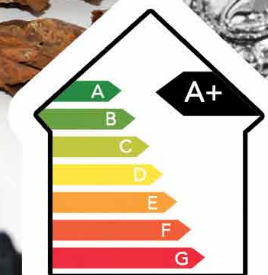
Chemiclean- metoden för högsta energiklass