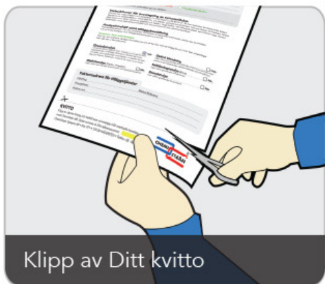
Klipp av Ditt kvitto