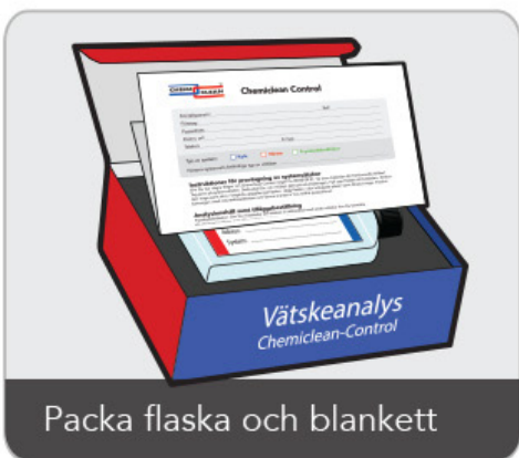
Packa flaska och blankett