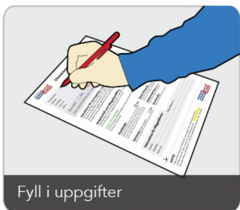
Fyll i uppgifter