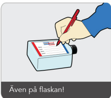
Även på flaskan!