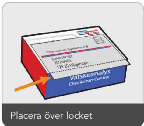
Placera över locket