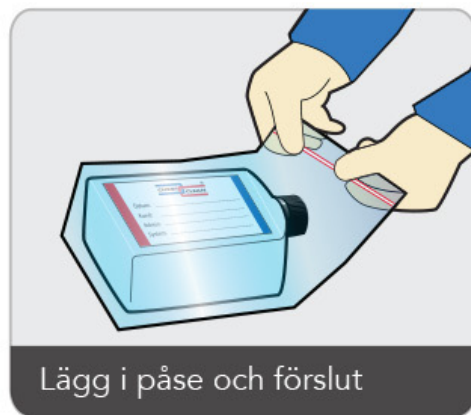
Lägg i påse och förslut