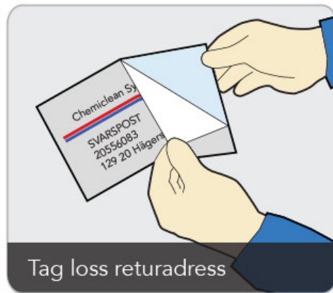
Tag loss returadress