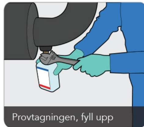
Provtagningen, fyll upp